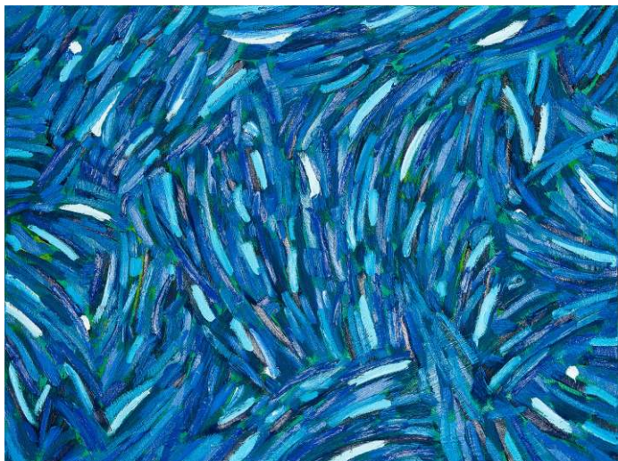
Baie des Anges (Nizza), 2009, Öl auf Leinwand, 60 x 80 cm

Vernissage am Freitag, 29. März um 19 Uhr