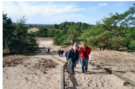
Wanderung in den Elbtaldünen

Die beiderseits der Elbe ähnlich dünn besiedelte Region wird überwiegend durch Busverkehr erschlossen, eine Rufbuslinie verbindet die Landkreise über die Elbe hinweg. Beide Landkreise stehen vor der Herausforderung, ihre Infrastrukturausstattung an den demografischen Wandel anzupassen.