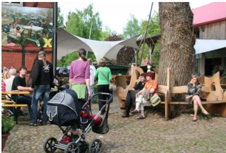
Die Kulturelle Landpartie – Ein überregionales Ereignis

Tourismus. Die Rundlingsdörfer tragen mit ihren typischen niederdeutschen Hallenhäusern dazu bei, den Bekanntheitsgrad des Wendlands als Erlebnisregion mit hoher Lebensqualität weiter zu steigern.