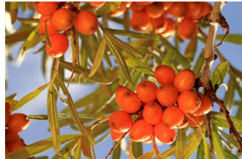
Sanddorn – Die Zitrone des Nordens

Die weit verbreiteten sandigen Böden in der Region um Ludwigslust haben optimale Bedingungen für den Anbau von Sanddorn. Mit rund 100 ha befindet sich hier das größte Anbaugbiet für BIO-Sanddorn in Deutschland.