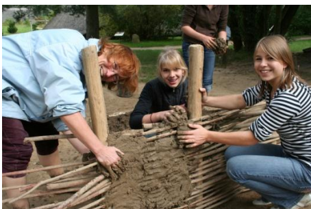
Geschichte zum Anfassen: Flechtwandbau im Archäologischen Zentrum Hitzacker