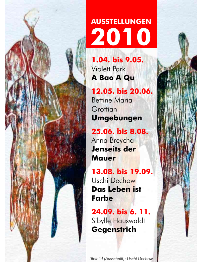
Titelbild (Ausschnitt): Uschi Dechow

24.09. bis 6. 11. Sibylle Hauswaldt Gegenstrich