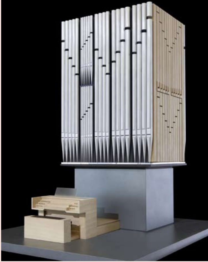
Modell der Chororgel in der St. Johannis-Kirche Lüneburg