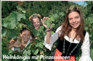
Weinkönigin mit Prinzessinnen