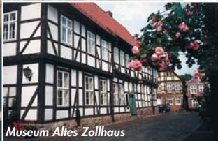
Museum Altes Zollhaus