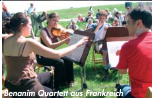
Benanim Quartett aus Frankreich