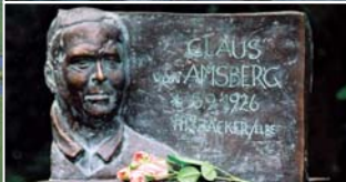
Prinz Claus der Niederlande