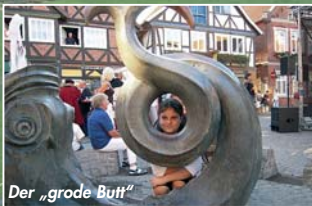
Der „grode Butt“