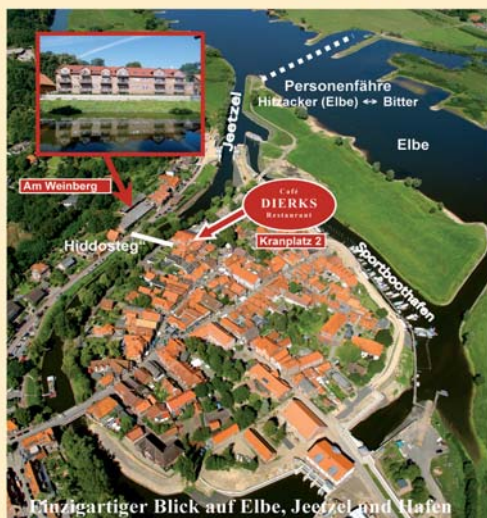
Einzigartiger Blick auf Elbe, Jeetzel und Hafen

Am Weinberg 2 • Kranplatz 2 29456 Hitzacker (Elbe)