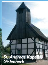
St. Andreas Kapelle, Gistenbeck