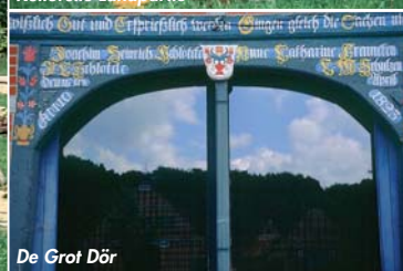
De Grof Dör

Vom Aussichtsturm an der Blockhütte lassen sich gut Urlaubspläne schmieden. Radeln durch die Walddörfer, Reiten in der Swinmark, eine Wandertour durch den Buchenhain im Gain oder Wassermühlen entdecken in der niederen Geest?