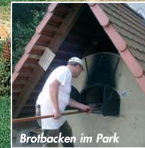
Broi'backen im Park